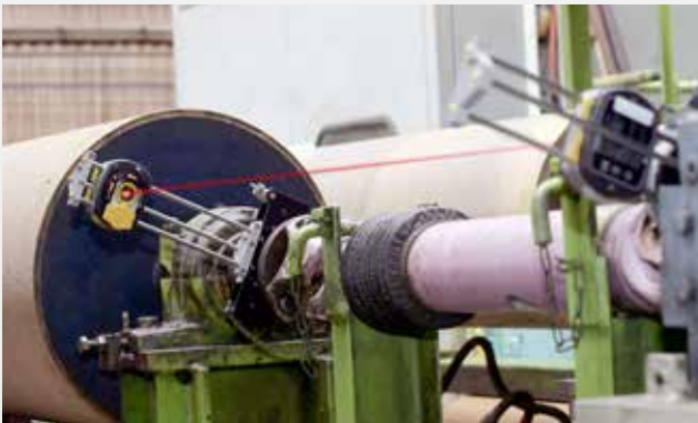
El juego de soportes para 180° de rotación solo requiere dos lecturas.

Gracias a los soportes especiales y a los nuevos métodos de medición, la plataforma ROTALIGN® Ultra iS permite alinear los ejes cardánicos sin desmontarlos.