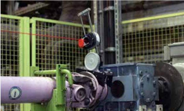
Soporte con brazo giratorio para zonas de rotación restringida.

Con nuestra exclusiva solución patentada, no es necesario desmontar los ejes cardánicos