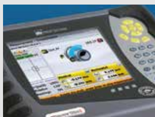
Sistemas de Alineación

Sistemas de alineación láser y servicios para una óptima alineación de máquinas y sistemas.