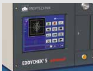
Ensayos No Destructivos

Sistemas de medición de vibraciones para la monitorización de condiciones de máquinas: incluyendo servicios como el diagnóstico de fallos de máquinas.