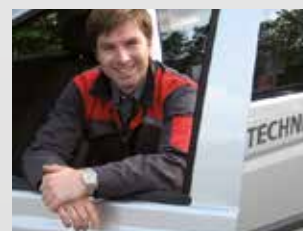
Mantenimiento & Asistencia

Sistemas y servicios para el aseguramiento de la calidad y el control de procesos en la producción.