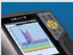
Monitorización de Condiciones

Sistemas de alineación láser y servicios para una óptima alineación de máquinas y sistemas.